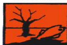
Periculos pentru mediu

Pentru deșeurile infecțioase care nu sunt tăietoare-intepătoare se folosesc cutii din carton prevăzute în interior cu saci din polietilena sau saci din polietilena galbeni ori marcați cu galben. Atât cutiile prevăzute în interior cu saci din polietilena, cât și sacii sunt marcați cu pictograma "Pericol biologic".